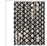
Carpet Artisan Pop 2 colors available Hand-tufted New Zealand wool e.g. 140 x 200 cm 849,00 Euro