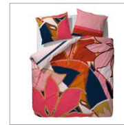
Bed linen Suze Cotton/sateen e.g. 135 x 200 cm 69,95 Euro