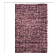
Carpet Purl 5 colors available Handwoven pure wool e.g. 130 x 190 cm 509,00 Euro