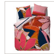
Bed linen Suze Cotton/sateen e.g. 135 x 200 cm 69,95 Euro