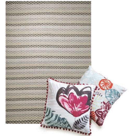
Carpet Massoni 160 x 230 cm € 929,00 Cushion cover Tara 45 x 45 cm € 24,99 Cushion cover Artisan 45 x 45 cm € 19,99

Wenn es draußen kühler wird, spielen wir drinnen mit Farbe. Mit leuchtendem Berry, Lime, Orange und natürlich Pink. Als Blüten, als Ethno-Pop, auf Kissen und Teppich. Ein lebendiger Kontrast zu ruhigen Sand- und Beigetönen, die sich dezent im Hintergrund halten.