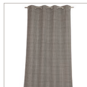
Curtain Impary Woven 140 x 250 cm 59,99 Euro