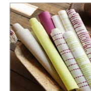
Wallpaper Artisan Fall Paper 0,53 x 10,05 m 18,95 Euro (solid) 18,95 Euro (stripe) 21,45 Euro (pattern)