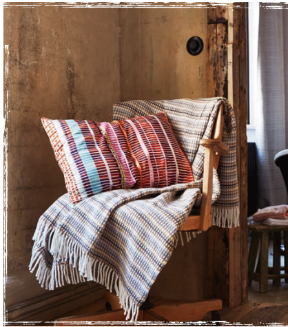
Cushion cover Colora 38 x 58 cm € 24,99 Plaid Milo 140 x 200 cm € 59,99

Wenn jeder Traum eine Reise ist – warum sollte man sie dann vorzeitig abbrechen? Unser Vorschlag: Liegen bleiben und inmitten des überbunten Herbstdesigns der Bettwäsche Suze den neuen Tag auf später verschieben.