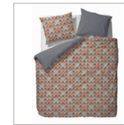
Bed linen Daina Cotton/sateen 135/200 cm + 80/80 cm 69,95 Euro