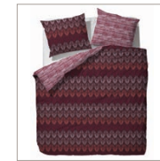
Bed linen Zoël 2 colors available Cotton/flannel 135/200 cm + 80/80 cm 49,95 Euro