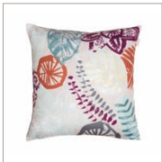
Cushion Artisan Printed cotton 45 x 45 cm 19,99 Euro