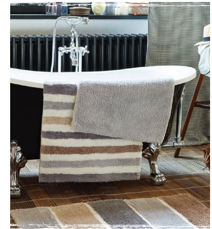
Bath mat Softy & Line Stripe 55 x 65 cm € 49,00

Alles für den perfekten Start: Der gewebte Vorhang Impary, der genau die richtige Dosis Morgenlicht zwischen seine Allover-Punkte hindurchstrahlen lässt. Dazu der kuschelige Badteppich Softy und nicht zu vergessen: die aktuelle Tageszeitung natürlich.