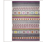
Carpet Ethnic Chic 2 colors available Handwoven pure wool e.g. 130 x 190 cm 769,00 Euro