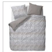
Bed linen Yelka 2 colors available Cotton/sateen 135/200 cm + 80/80 cm 59,95 Euro