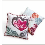
Cushion Tara/Artisan Printed cotton 45 x 45 cm 24,99 Euro/19,99 Euro