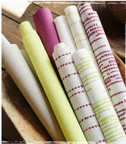
Wallpaper Artisan Fall 0,53 x 10,05 m from € 18,95/roll

Lasst sie uns einfach Wandschmuck nennen! Wie auf eine Perlenkette aufgezogen regnen auf der Vliestapete Artisan Fall bunte Punkte herab. Schnurgerade, haargenau auf die fein- strukturierten Unis abgestimmt.