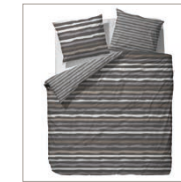
Bed linen Laure 2 colors available Cotton/flannel 135/200 cm + 80/80 cm 49,95 Euro