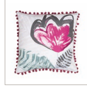
Cushion Tara Printed cotton 45 x 45 cm 24,99 Euro