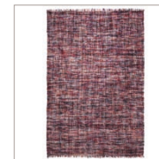
Carpet Purl 5 colors available Handwoven pure wool e.g. 130 x 190 cm 509,00 Euro