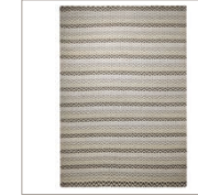
Carpet Massoni 2 colors available Handwoven pure wool e.g. 130 x 190 cm 619,00 Euro