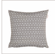
Cushion Pixel Graphic woven 38 x 38 cm 17,99 Euro