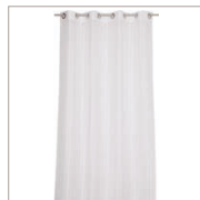
Curtain Dotty Burnut on Voile 140 x 250 cm 49,99 Euro