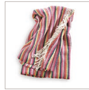
Plaid Milo 2 colors available Cotton mix 140 x 200 cm 59,99 Euro