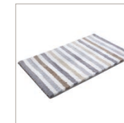
Bath mat Line Stripe 2 colors available Polyester microfiber e.g. 55 x 65 cm 49,00 Euro