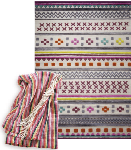
Carpet Ethnic Chic 130 x 190 cm € 769,00 Plaid Milo 140 x 200 cm € 59,99

Die schönsten Abende sind die, an denen jeder eine andere Geschichte zu erzählen hat. So wie der Ethno-Tischläufer Pixel im Ikat-Look, der poppig bunte Tischläufer Colora und die Kissenhüllen Pixel, Artisan sowie Impary.