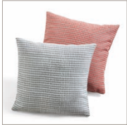
Cushion Impary 4 colors available and Table runners & curtains 38 x 38 cm 19,99 Euro