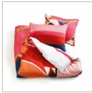
Bed linen Suze Cotton/sateen e.g. 135/200 cm + 80/80 cm 69,95 Euro

All prices in this brochure are German recommended retail prices and may vary from country to country.