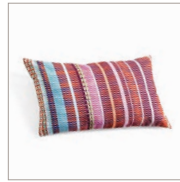
Cushion Colora Printed cotton canvas 38 x 58 cm 24,99 Euro