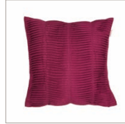
Cushion Evo Polyester/cotton 38 x 38 cm 19,99 Euro