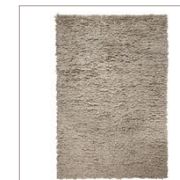
Carpet Fluffy 4 colors available Handwoven in India Polyester/cotton e.g. 130 x 190 cm 99,00 Euro