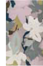
CARPET BLOOM New Zealand wool Handtufted e.g. 170 x 240 cm 979,00 Euro