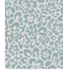
WALLPAPER RELAX IN WINTER Striped design in 4 colors Non-woven textile 0,53 x 10,05 m (5,33 qm) 24,95 Euro