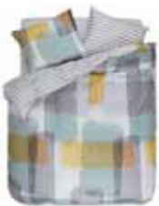
BED LINEN MAKIA Printed cotton/sateen e.g. 135/200 cm + 80/80 69,95 Euro