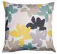
CUSHION WINTER Digital printed canvas 48 x 48 cm 19,99 Euro

All prices in this brochure are German recommended retail prices and may vary from country to country.