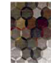
CARPET MODERNINA Handwoven polypropylen heatset frisée e.g. 160 x 225 cm 199,00 Euro