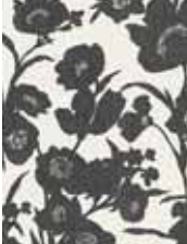
WALLPAPER FALL IN LOVE Flower design in 4 colors Non-woven textile 0,53 x 10,05 m (5,33 qm) 24,95 Euro