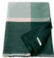
PLAID CARO Woven acrylic 150 x 200 cm 79,99 Euro