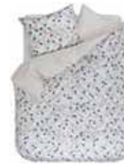
BED LINEN DARIA Digital printed cotton/sateen e.g. 135/200 cm + 80/80 79,95 Euro