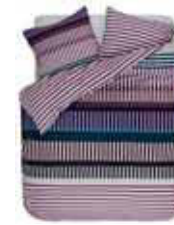
BED LINEN NAMPA 2 colors available Printed cotton flannel e.g. 135/200 cm + 80/80 49,95 Euro