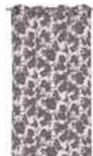
CURTAIN KALEA 2 colors available Printed on voile 140 x 250 cm 39,99 Euro