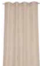
CURTAIN DOTY 2 colors available Woven jacquard design 140 x 250 cm 59,99 Euro