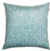
CUSHION LAGO 2 colors available Digital printed microfiber 45 x 45 cm 24,99 Euro