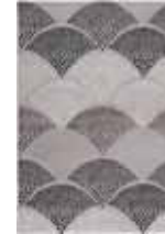
CARPET CHIMERA 2 colors available Handwoven 100% cotton e.g. 160 x 230 cm 269,00 Euro