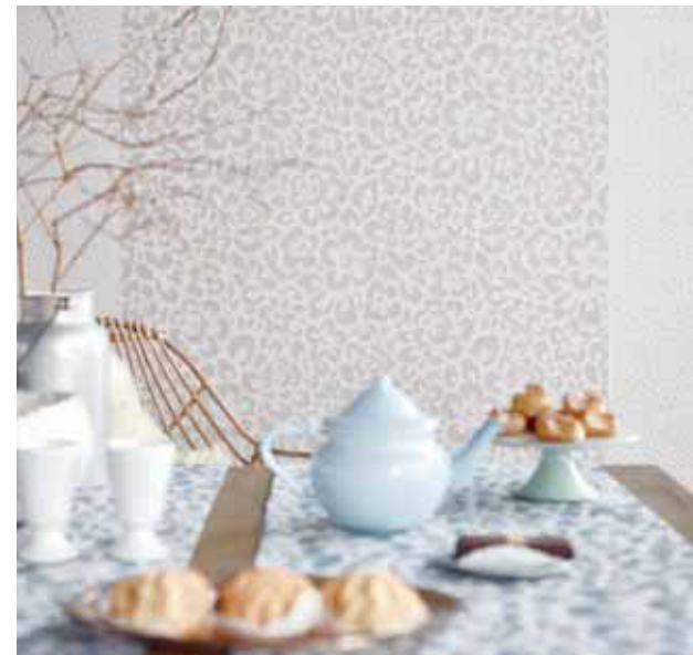
WALLPAPER RELAX IN WINTER 5,33 qm € 21,95 - € 24,95