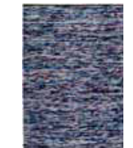
CARPET REFLECTION 2 colors available Handwoven wool/cotton e.g. 130 x 190 cm 509,00 Euro