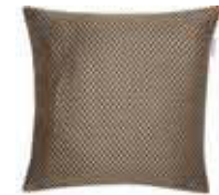
CUSHION GOLDEN Woven jacquard design 38 x 38 cm 17,99 Euro