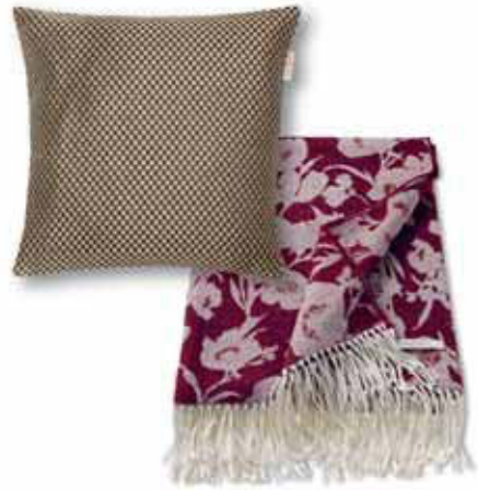
CUSHION COVER GOLDEN 38 x 38 cm € 17,99 PLAID SILUETA 150 x 200 cm € 79,99