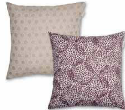
CUSHION COVER DOTY 45 x 45 cm € 17,99 CUSHION COVER LIV 38 x 38 cm € 15,99