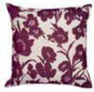
CUSHION SILUS 3 colors available Woven jacquard design 45 x 45 cm 24,99 Euro

All prices in this brochure are German recommended retail prices and may vary from country to country.