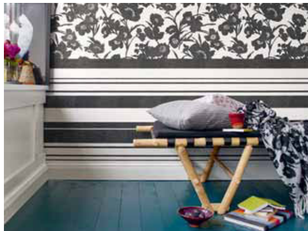
WALLPAPER FALL IN LOVE 5,33 qm € 21,95 - € 24,95 CUSHION COVER IMPARY 48 x 48 cm € 19,99, DOTY 45 x 45 cm € 17,99 PLAID SILUETA BLACK 150 x 200 cm € 79,99