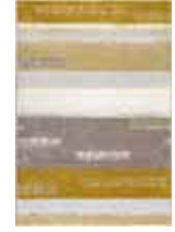
CARPET DREAMING 2 colors available Handwoven polypropylene heatset frisée e.g. 160 x 225 cm 199,00 Euro