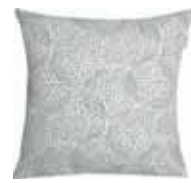
CUSHION LIV 4 colors available Digital printed canvas 38 x 38 cm 15,99 Euro