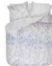
BED LINEN LAGAI Printed cotton/sateen e.g. 135/200 cm + 80/80 69,95 Euro