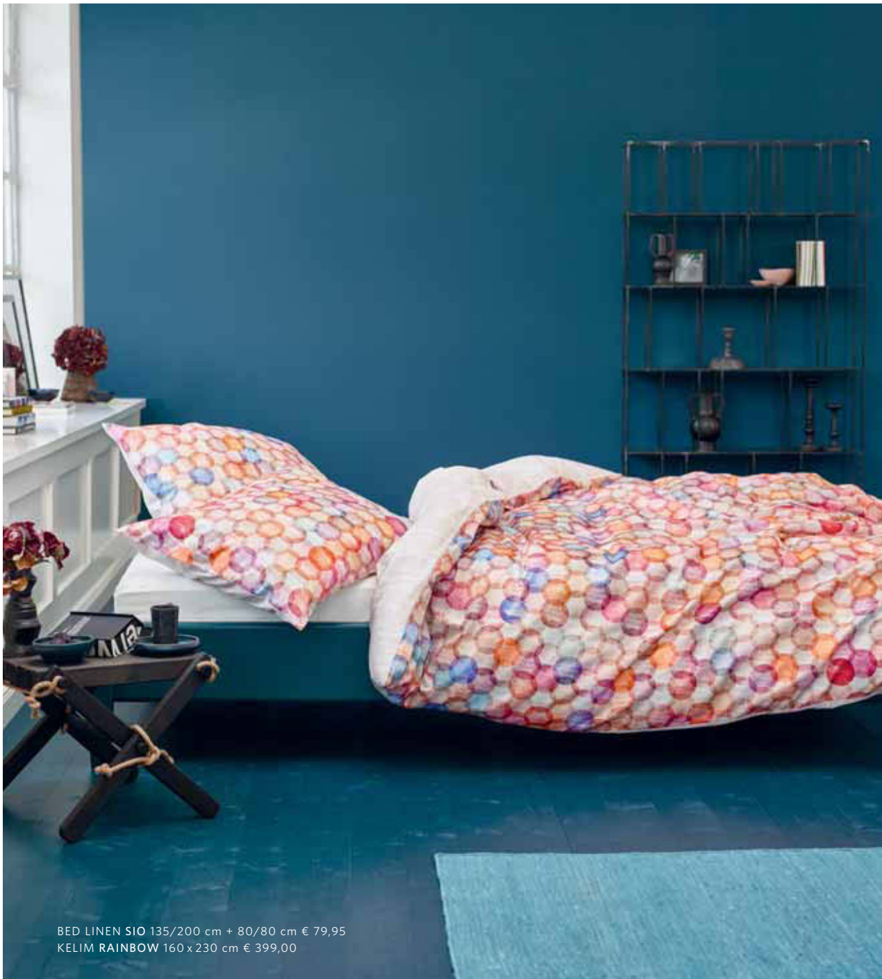
BED LINEN SIO 135/200 cm + 80/80 cm € 79,95 KELIM RAINBOW 160 x 230 cm € 399,00