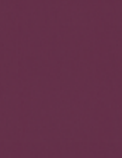
WALLPAPER FALL IN LOVE Solid in 4 colors Non-woven textile 0,53 x 10,05 m (5,33 qm) 21,95 Euro