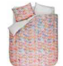
BED LINEN SIO Digital print with piping Cotton/sateen e.g. 135/200 cm + 80/80 79,95 Euro