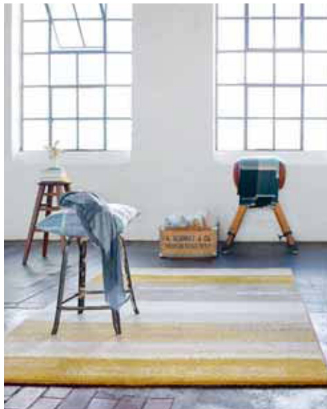
CARPET DREAMING 200 x 290 cm € 319,00