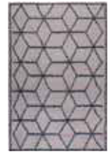
CARPET FIESTA 2 colors available Handwoven wool cotton e.g. 160 x 230 cm 659,00 Euro