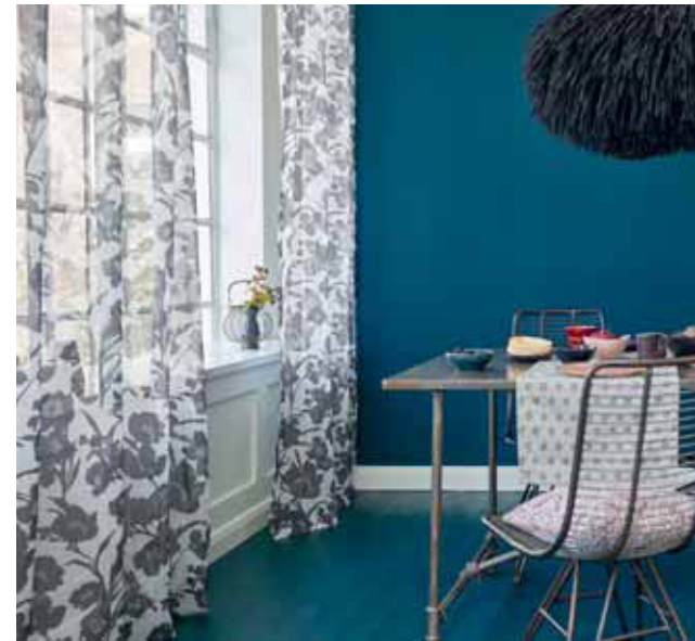
CURTAIN KELEA 140 x 250 cm € 39,99