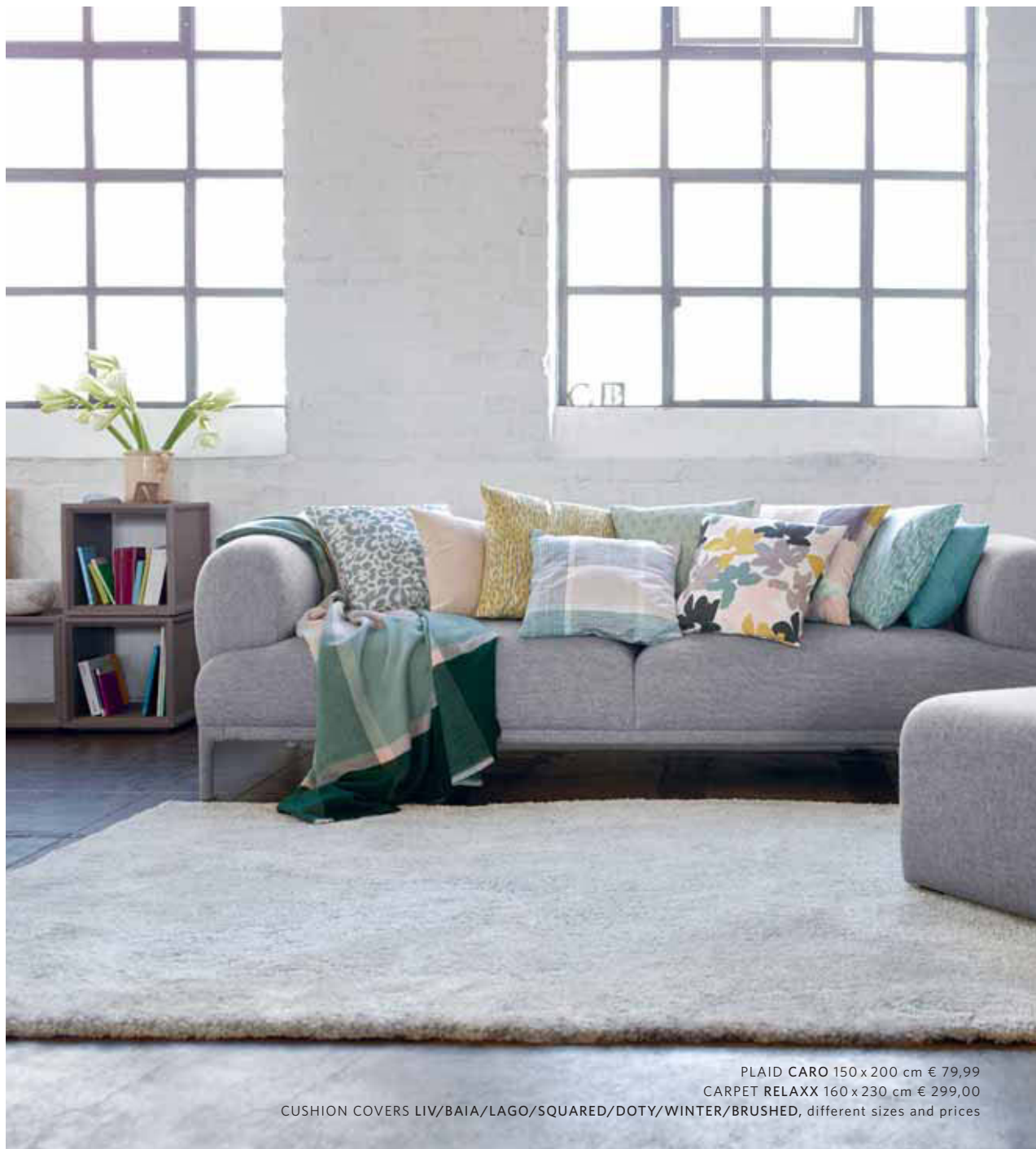
PLAID CARO 150 x 200 cm € 79,99 CARPET RELAXX 160 x 230 cm € 299,00 CUSHION COVERS LIV/BAIA/LAGO/SQUARED/DOTY/WINTER/BRUSHED, different sizes and prices