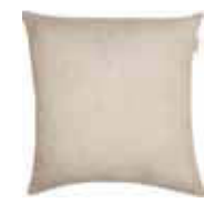
CUSHION BAIA 3 colors available Woven material 45 x 45 cm 19,99 Euro