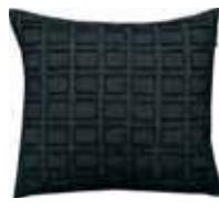
CUSHION SQUAR Woven design 38 x 38 cm 19,99 Euro