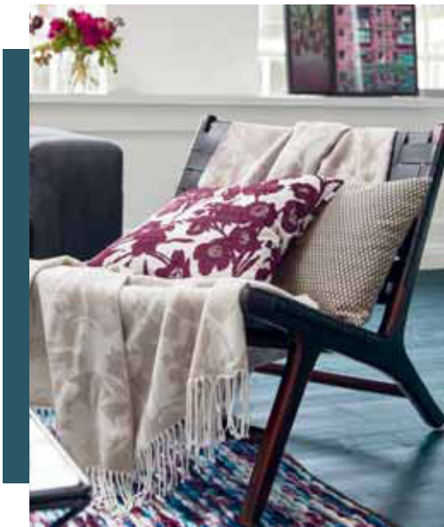
CUSHION COVER SILUS 45 x 45 cm € 24,99 CUSHION COVER GOLDEN 38 x 38 cm € 17,99 PLAID SILUETA 150 x 200 cm € 79,99