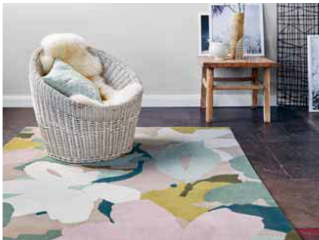
CARPET BLOOM 170 x 240 cm € 979,00