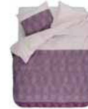
BED LINEN TAMO 2 colors available Printed cotton flannel e.g. 135/200 cm + 80/80 49,95 Euro