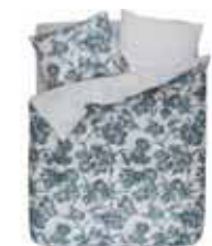
BED LINEN ARAI Digital print with piping Cotton/sateen e.g. 135/200 cm + 80/80 79,95 Euro