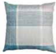
CUSHION SQUARED Digital printed microfiber 45 x 45 cm 24,99 Euro