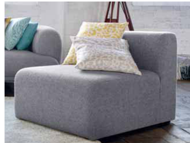
CUSHION COVERS LEO 45x45 cm € 19,99