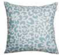
CUSHION LEO 3 colors available Digital printed microfiber 45 x 45 cm 19,99 Euro