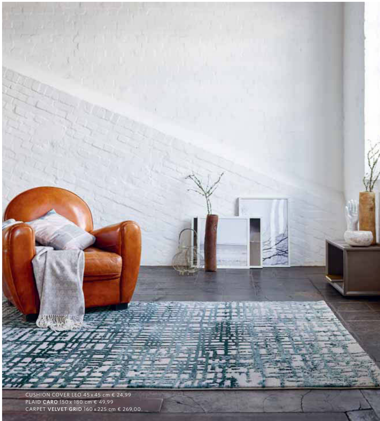
CUSHION COVER LEO 45 x 45 cm € 24,99 PLAID CARO 150 x 180 cm € 49,99 CARPET VELVET GRID 160 x 225 cm € 269,00