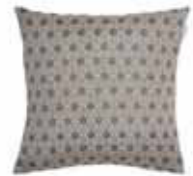
CUSHION DOTY 5 colors available Woven jacquard design 45 x 45 cm 17,99 Euro