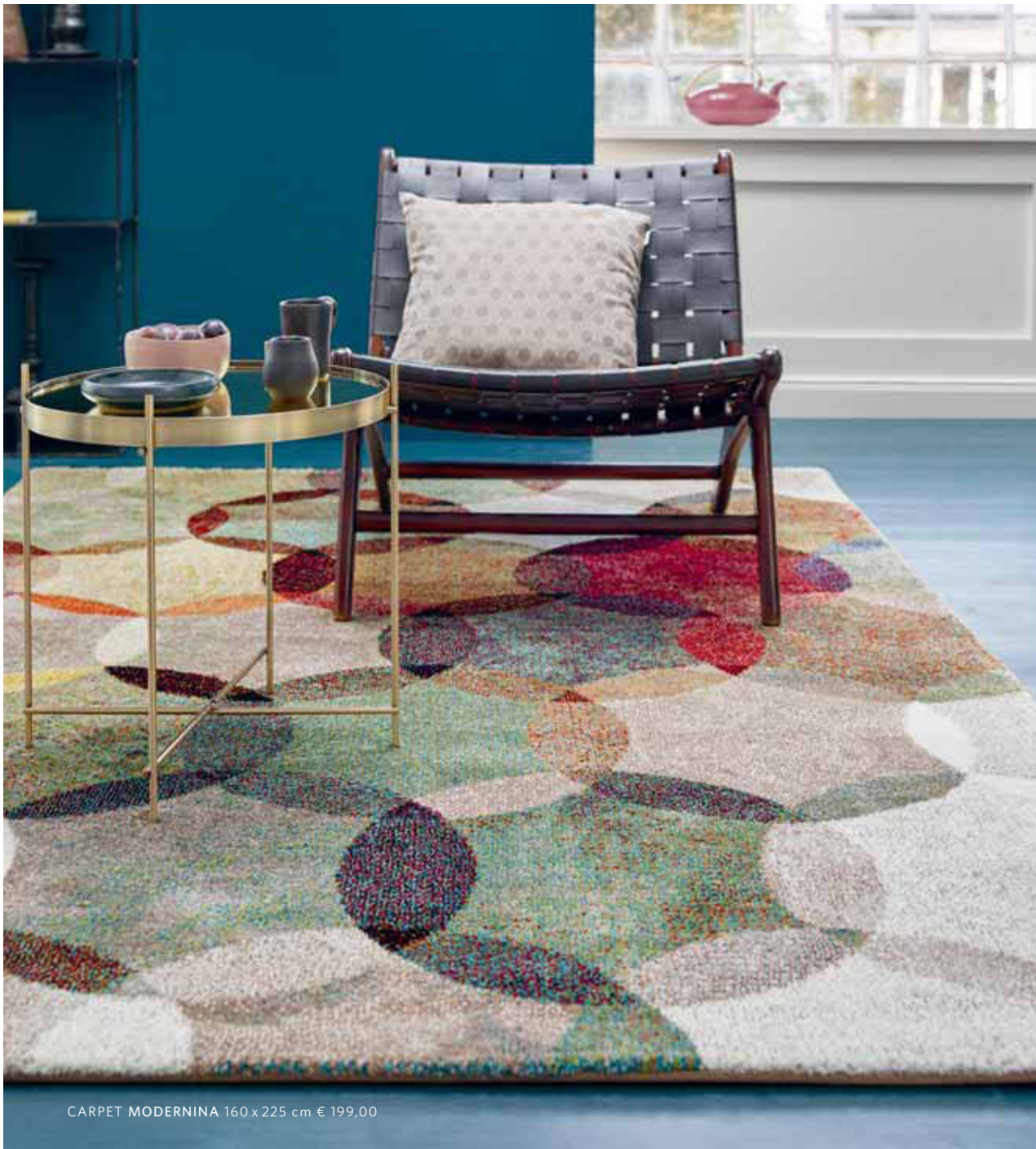
CARPET MODERNINA 160 x 225 cm € 199,00