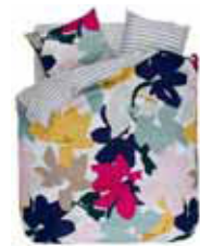
BED LINEN SERAI Printed cotton/sateen e.g. 135/200 cm + 80/80 69,95 Euro