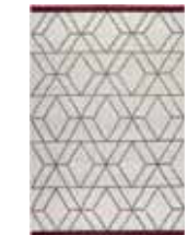
CARPET HEXAGON Handwoven wool/cotton e.g. 160 x 230 cm 659,00 Euro