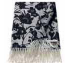
PLAID SILUETA 3 colors available Woven acrylic 150 x 200 cm 79,99 Euro