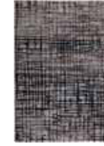
CARPET VELVET GRID Machinewoven in Turkey e.g. 160 x 225 cm 269,00 Euro