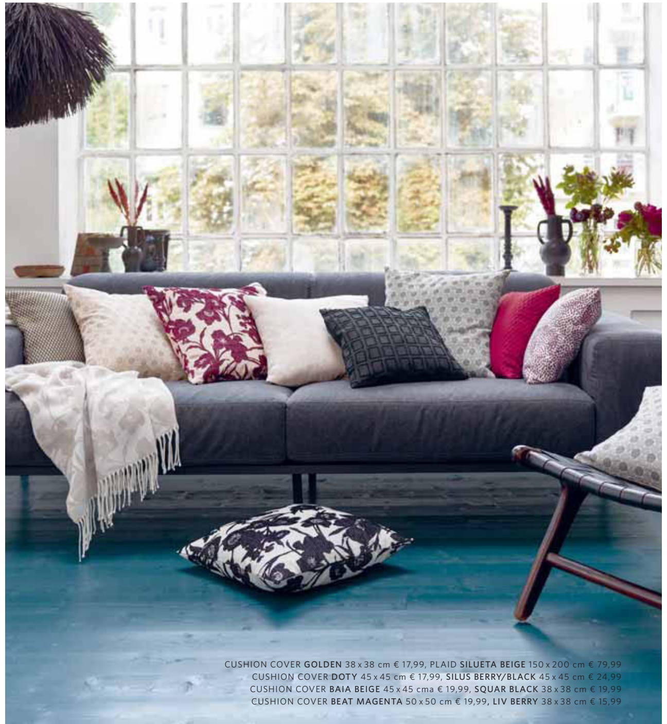
CUSHION COVER GOLDEN 38 x 38 cm € 17,99, PLAID SILUETA BEIGE 150 x 200 cm € 79,99 CUSHION COVER DOTY 45 x 45 cm € 17,99, SILUS BERRY/BLACK 45 x 45 cm € 24,99 CUSHION COVER BAIJA BEIGE 45 x 45 cm € 19,99, SQUAR BLACK 38 x 38 cm € 19,99 CUSHION COVER BEAT MAGENTA 50 x 50 cm € 19,99, LIV BERRY 38 x 38 cm € 15,99