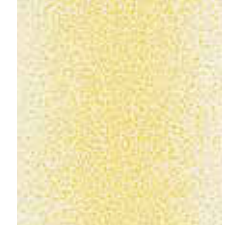
WALLPAPER RELAX IN WINTER Striped design in 4 colors Non-woven textile 0,53 x 10,05 m (5,33 qm) 23,95 Euro