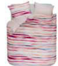
BED LINEN MANGE 2 colors available digital printed cotton/sateen e.g. 135/200 cm + 80/80 69,95 Euro