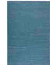
KELIM RAINBOW 13 colors available Handwoven 100% cotton e.g. 160 x 230 cm 399,00 Euro