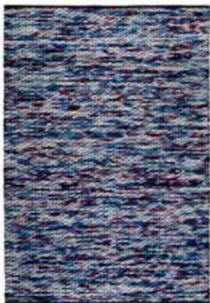
CARPET REFLECTION 130 x 190 cm € 509,00