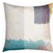
CUSHION BRUSHED Digital printed microfiber 45 x 45 cm 24,99 Euro