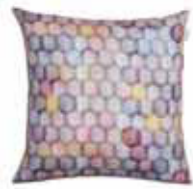
CUSHION SIO Digital printed canvas 48 x 48 cm 19,99 Euro