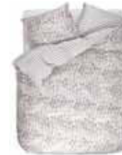
BED LINEN KRISA 2 colors available Printed cotton/sateen e.g. 135/200 cm + 80/80 69,95 Euro