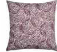
CUSHION LIV 4 colors available Woven jacquard design 38 x 38 cm 15,99 Euro