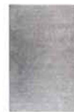
CARPET RELAXX 5 colors available Tabletufted polyester e.g. 160 x 230 cm 299,00 Euro