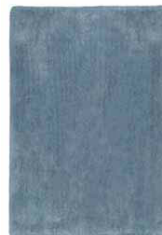
CARPET RELAXX 160x230 cm € 299,00