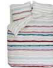
BED LINEN LAURE Digital print flannel e.g. 135/200 cm + 80/80 49,95 Euro