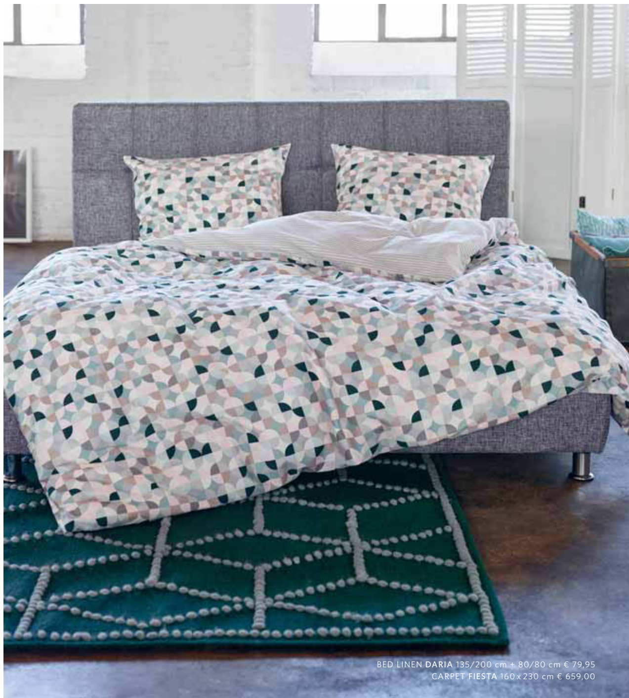
BED LINEN DARIA 135/200 cm + 80/80 cm € 79,95 CARPET FIESTA 160 x 230 cm € 659,00