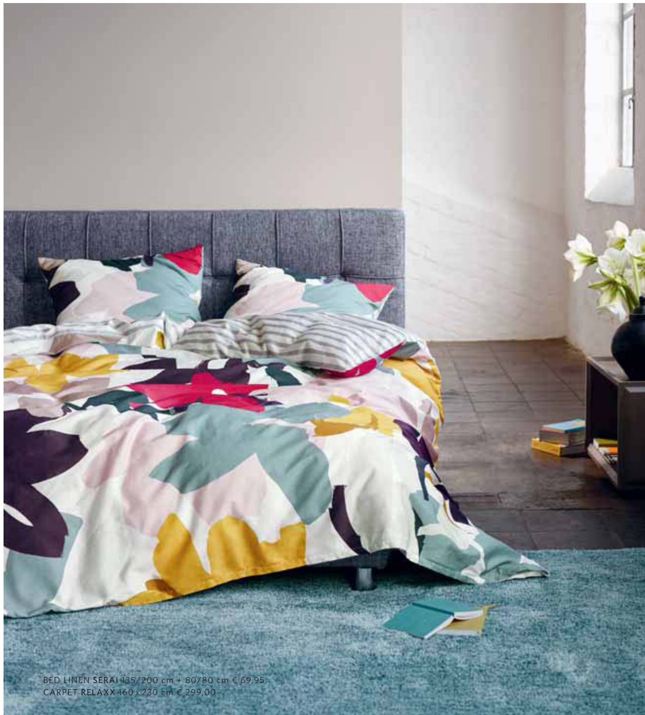
BED LINEN SERAI 135/200 cm + 80/80 cm € 69,95 CARPET RELAXX 160x230 cm € 299,00