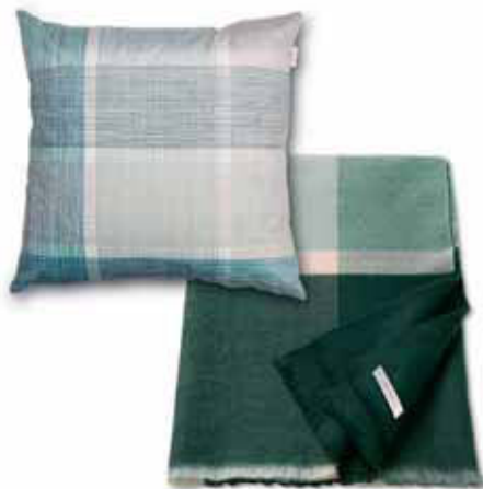
PLAID CARO 150 x 200 cm € 79,99 CUSHION COVER SQUARED 45 x 45 cm € 24,99