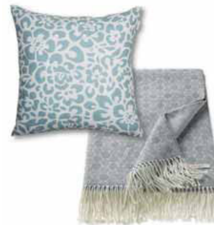
PLAID DORO 150 x 180 cm € 49,99 CUSHION COVER LEO 45 x 45 cm € 19,99