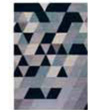
KELIM TRIANGLE 2 colors available Handwoven 100% cotton e.g. 160 x 230 cm 589,00 Euro