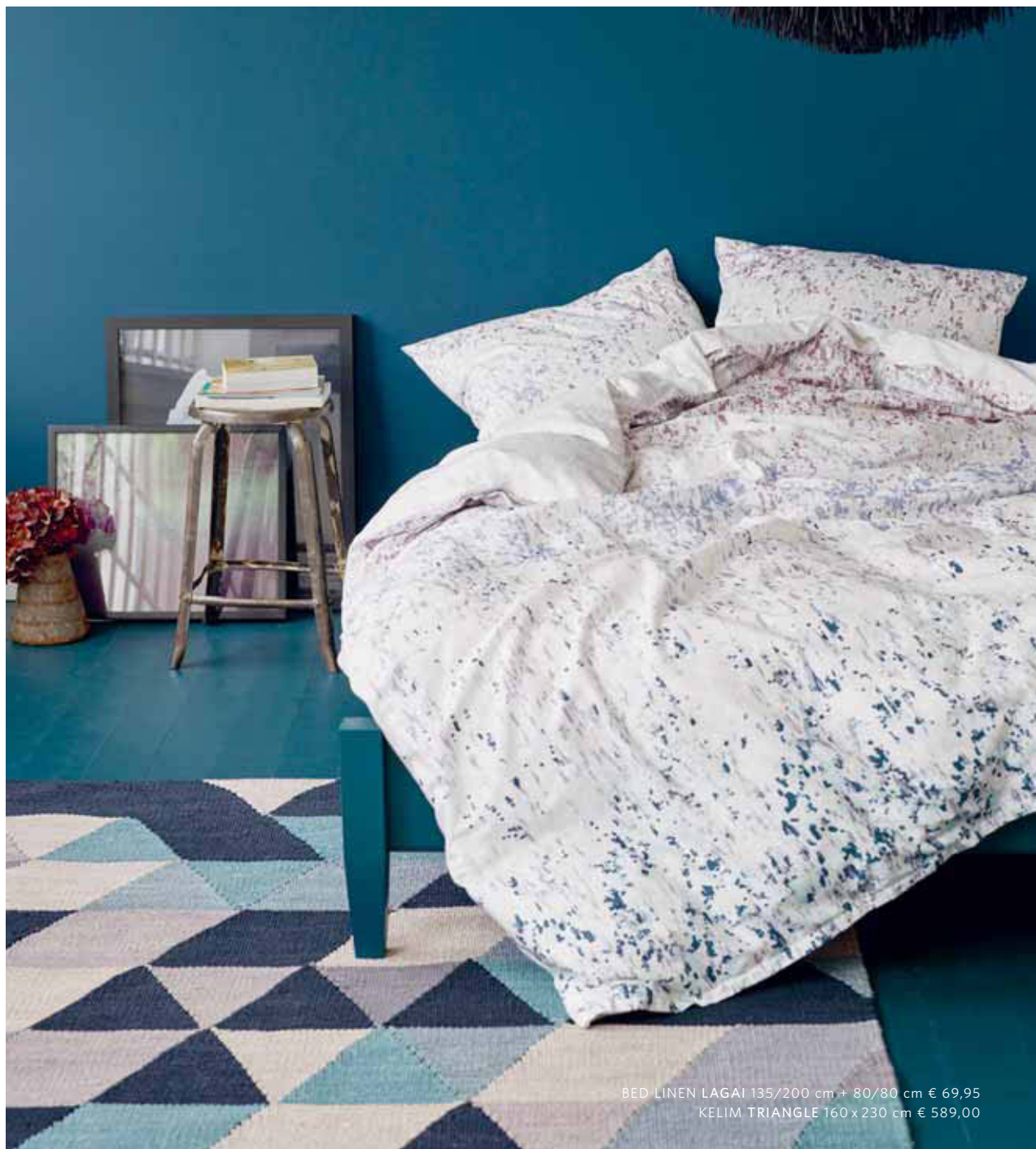
BED LINEN LAGAI 135/200 cm + 80/80 cm € 69,95 KELIM TRIANGLE 160 x 230 cm € 589,00