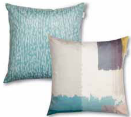
CUSHION COVER LAGO 45 x 45 cm € 24,99 CUSHION COVER BRUSHED 45 x 45 cm € 24,99