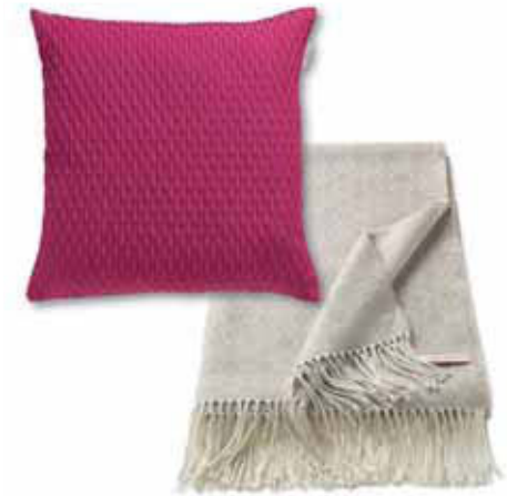
PLAID DORO 150 x 180 cm € 49,99 CUSHION COVER BEAT 45 x 45 cm € 15,99