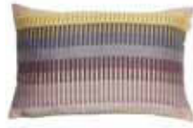
CUSHION TRIO Jacquard design 38 x 58 cm 24,99 Euro