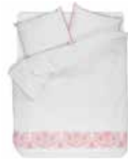
BED LINEN TARIJA 100 % Cotton Percale with pompons e.g. 135/200 cm + 80/80 99,95 Euro