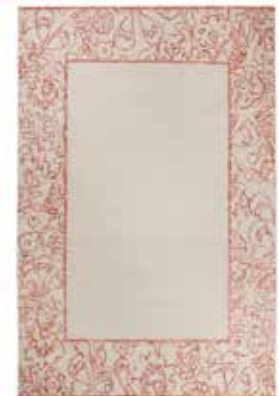
KELIM KAYLA BORDER e.g. 130 x 190 cm / € 349,00