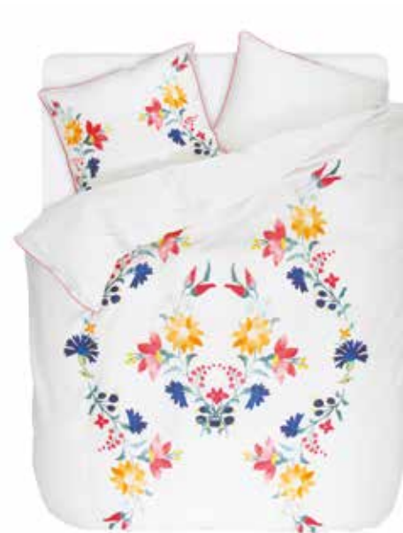
BED LINEN CAMI e.g. 135/200 cm + 80/80 € 79,95