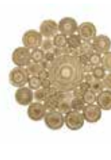
CARPET CEYCLE NATURE 2 colors available handwoven jute rd. 200 cm 129,00 Euro