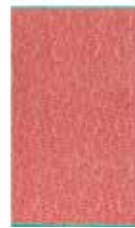
BEACH TOWEL LEAF 100 x 180 cm 39,99 Euro