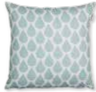
CUSHION RAINNS 4 colors available 38 x 38 cm 17,99 Euro