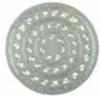
CARPET CROCHET STYLE 3 colors available handwoven wool rd. 120 cm 129,00 Euro