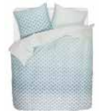
BED LINEN RAINNS 2 colors available 100% Cotton Satin e.g. 135/200 cm + 80/80 69,95 Euro