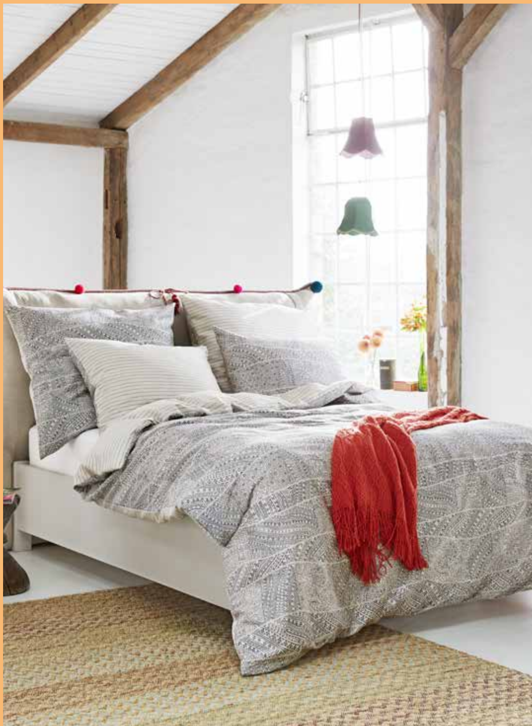
BED LINEN TRIBAL WAVES e.g. 135/200 cm + 80/80 / € 69,95 CAPRET ZIGZAG NATURE e.g. 160 x 230 cm / € 399,00