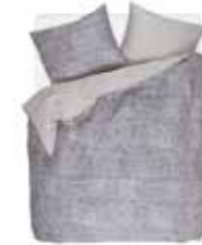
BED LINEN TRIBAL WAVES 100 % Cotton Satin e.g. 135/200 cm + 80/80 69,95 Euro