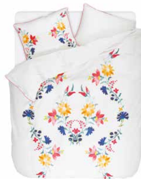
BED LINEN CAMI e.g. 135/200 cm + 80/80 € 79,95