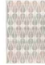
CARPET ZENO 2 colors available machine-woven e.g. 160 x 225 cm 199,00 Euro