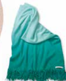
PLAID OMBRE 140x200 cm / € 69,99