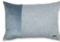
CUSHION HARP 7 colors available 2 sizes available 38 x 58 cm, 38 x 38 cm 19,99 Euro, 17,99 Euro