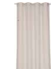
CURTAIN HARP 2 colors available Woven jacquard design 140 x 250 cm 49,99 Euro