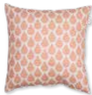
CUSHION RAINNS 4 colors available 38 x 38 cm 17,99 Euro