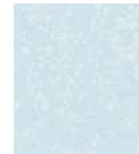
WALLPAPER ROMANTIC BOTANICS Flower design in 4 colors 0,53 x 10,05 m (5,33 sqm) 23,95 Euro