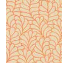
WALLPAPER NOSTALGIC FOLKLORE Flower design in 3 colors 0,53 x 10,05 m (5,33 sqm) 21,95 Euro