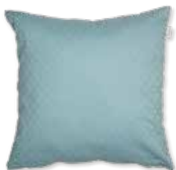
CUSHION POSIE 45 x 45 cm / € 24,99