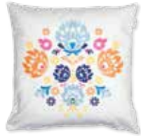
CUSHION FOLKFLOWER 45 x 45 cm 29,99 Euro

All prices in this brochure are German recommended retail prices and may vary from country to country.