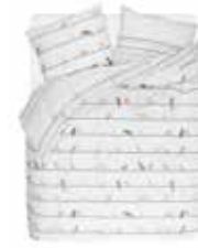
BED LINEN BIRDIES 100% Cotton Percalé e.g. 135/200 cm + 80/80 49,95 Euro