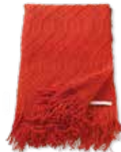
PLAID WEAVE 2 colors available 140 x 200 cm 69,99 Euro