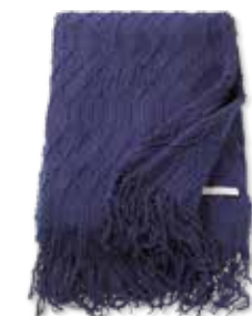
PLAID WEAVE 140 x 200 cm / € 69,99