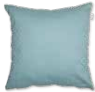
CUSHION POSIE 2 colors available 45 x 45 cm 24,99 Euro