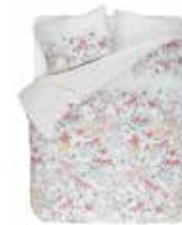
BED LINEN EDIE 100% Cotton Satin e.g. 135/200 cm + 80/80 69,95 Euro