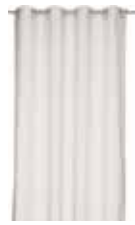
CURTAIN MARO Burnout on foile 140 x 250 cm 49,99 Euro