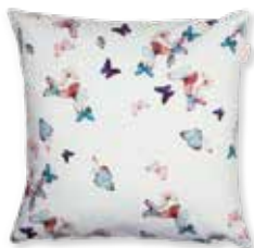
CUSHION FLY 38 x 38 cm / € 19,99