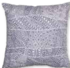
CUSHION TRIBAL 38 x 38 cm / € 17,99

KELIM NILAS HAUTE e.g. 130x190 cm / € 599,00