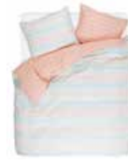
BED LINEN TYRA 100% Cotton Percalé e.g. 135/200 cm + 80/80 49,95 Euro