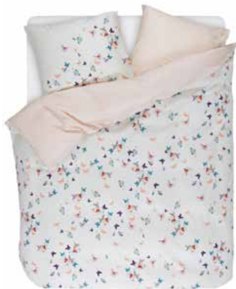
BED LINEN BUTTERLIES e.g. 135/200 cm + 80/80 € 69,95