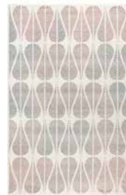
CARPET ZENO e.g. 160 x 225 cm / € 199,00