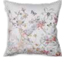
CUSHION EDIE 45 x 45 cm 19,99 Euro