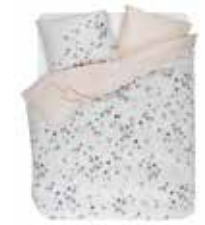
BED LINEN BUTTERFLIES 100% Cotton Satin e.g. 135/200 cm + 80/80 69,95 Euro