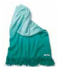
PLAID OMBRE 3 colors available 45 x 45 cm 69,99 Euro