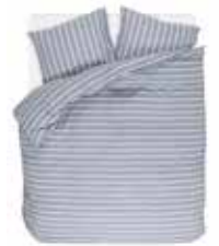
BED LINEN ELLI 100% washed Cotton e.g. 135/200 cm + 80/80 79,95 Euro