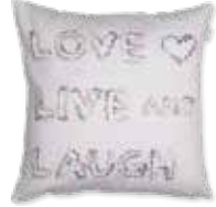
CUSHION LIVE 45 x 45 cm 19,99 Euro