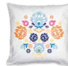
CUSHION FOLKFLOWER 45 x 45 cm / € 29,99