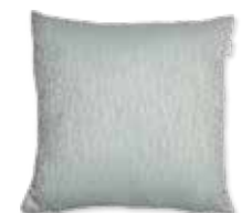
CUSHION FAN 45 x 45 cm / € 19,99