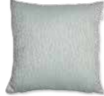
CUSHION FAN 3 colors available 45 x 45 cm 19,99 Euro