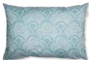
CUSHION DROPS 38 x 58 cm / € 22,99