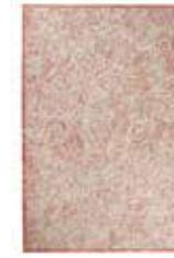
KAYLA KELIM 2 colors available maschinewoven e.g. 130 x 190 cm 349,00 Euro