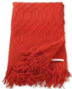
PLAID WEAVE 140 x 200 cm / € 69,99