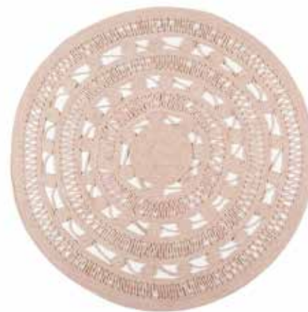
CARPET CROCHET STYLE rd. 120 cm / € 129,00