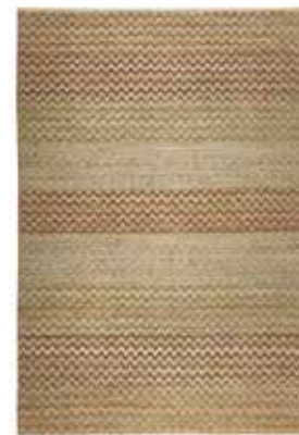
CARPET ZIGZAG NATURE e.g. 130x190 cm / € 269,00