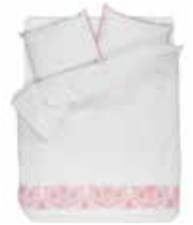
BED LINEN TARIJA 100 % Cotton Percale with pompons e.g. 135/200 cm + 80/80 99,95 Euro