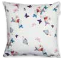
CUSHION FLY 38 x 38 cm 19,99 Euro