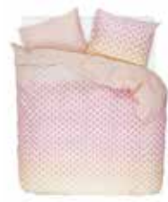
BED LINEN RAINNS 2 colors available 100 % Cotton Satin e.g. 135/200 cm + 80/80 69,95 Euro