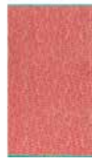
BEACH TOWEL LEAF 100 x 180 cm 39,99 Euro