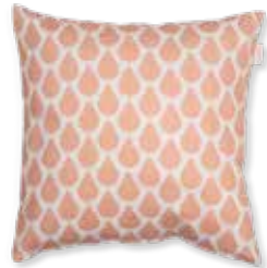
CUSHION RAINNS 38 x 38 cm / € 17,99