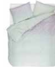
BED LINEN DOTTI 100 % Cotton Satin e.g. 135/200 cm + 80/80 69,95 Euro