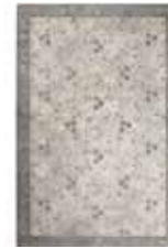
CARPET FLORA 2 colors available machine-woven e.g. 160 x 225 cm 269,00 Euro