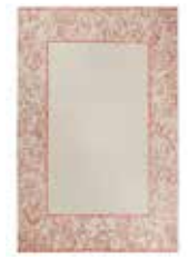
KAYLA KELIM BORDER 2 colors available maschinewoven e.g. 130 x 190 cm 349,00 Euro