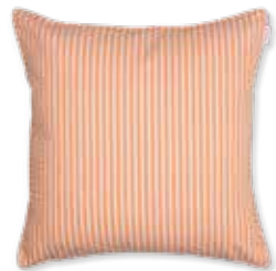
CUSHION STRIPE 45 x 45 cm / € 19,99