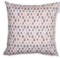
CUSHION FOLK 45 x 45 cm 19,99 Euro