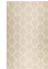
RAINNS KELIM 3 colors available handwoven wool e.g. 160 x 230 cm 399,00 Euro