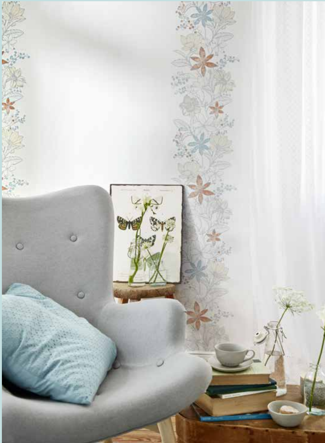
WALLPAPER ROMANTIC BOTANICS 0,53 x 10,05 cm / € 23,95 CUSHION POSIE 45 x 45 cm / € 24,99