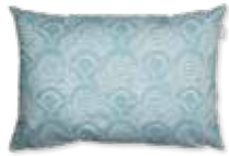
CUSHION DROPS 2 colors available 38 x 58 cm 22,99 Euro

All prices in this brochure are German recommended retail prices and may vary from country to country.