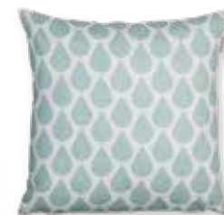
CUSHION RAINNS 38x38 cm / € 17,99