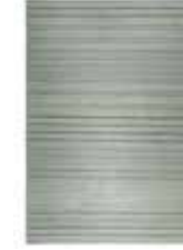
AURELIA KELIM 3 colors available handwoven wool e.g. 160 x 230 cm 499,00 Euro