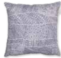
CUSHION TRIBAL 38 x 38 cm 17,99 Euro