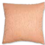
CUSHION FAN 3 colors available 45 x 45 cm 19,99 Euro