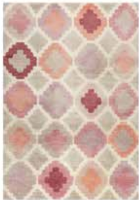
KELIM NILAS HAUTE e.g. 160 x 230 cm / € 799,00