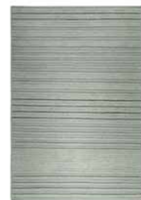
KELIM AURELIA e.g. 160 x 230 cm / € 499,00