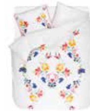
BED LINEN CAMI 100 % Cotton Satin with paspel e.g. 135/200 cm + 80/80 79,95 Euro