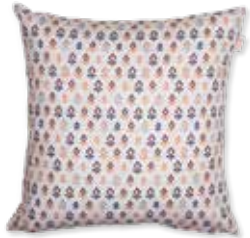
CUSHION FOLK 45 x 45 cm / € 19,99