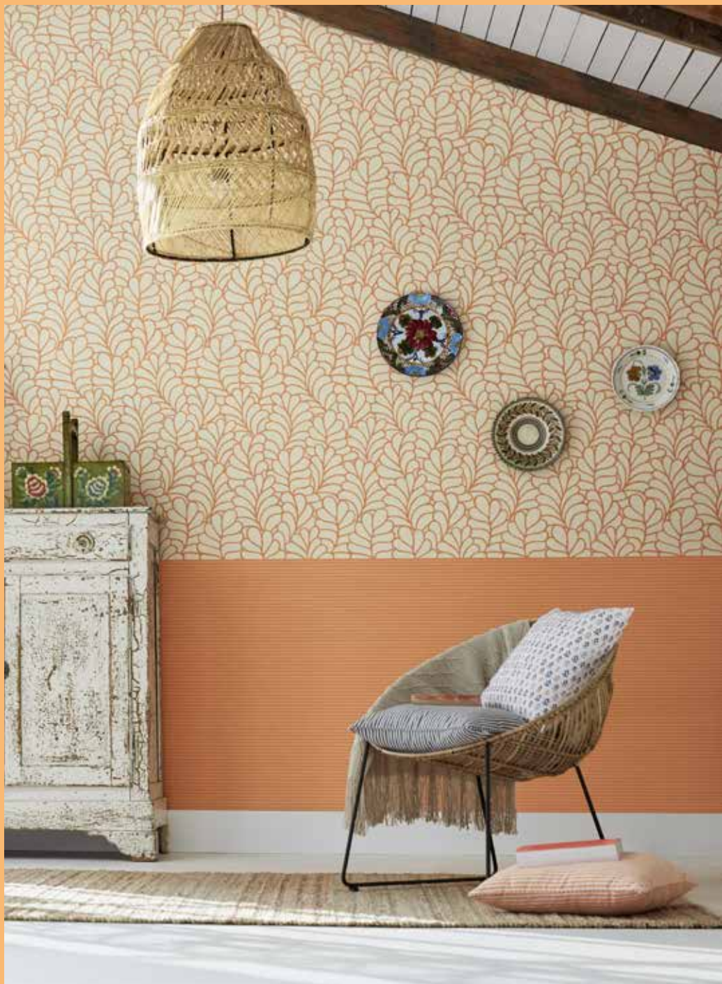
WALLPAPER NOSTALGIC FOLKLORE 0,53 x 10,05 cm / € 21,95 CUSHION FOLK 45 x 45 cm / € 19,99