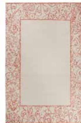
KELIM KAYLA BORDER e.g. 130 x 190 cm / € 349,00