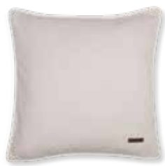
CUSHION HARP 38 x 38 cm / € 17,99

CURTAIN POSIE 140 x 250 cm / € 79,99 KELIM RAINNIS e.g. 130 x 190 cm / € 269,00