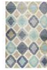
NILAS HAUTE KELIM 2 colors available handwoven wool e.g. 130 x 190 cm 599,00 Euro