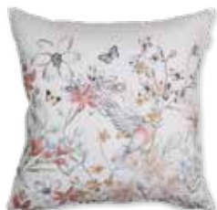
CUSHION EDIE 45 x 45 cm / € 19,99

BED LINEN EDIE e.g. 135/200 cm + 80/80 / € 69,95 KELIM AURELIA e.g. 160x 230 cm / € 499,00