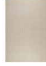
LOTTE KELIM 2 colors available maschine-woven e.g. 130 x 190 cm 349,00 Euro