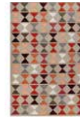
CARPET MAHAN 3 colors available New Zealand wool e.g. 120 x 180 cm 499,00 Euro