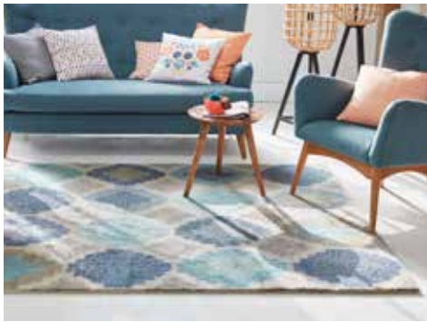
CARPET CEYCLE NATURE rd. 1200 cm / € 129,00 CUSHION FOLK 45 x 45 cm / € 19,99