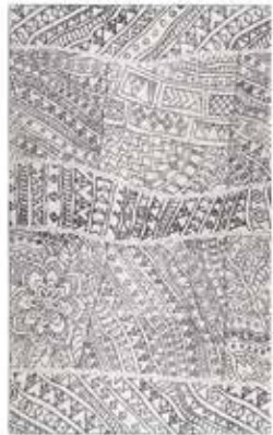
KELIM COSMO e.g. 160 x 230 cm / € 299,00