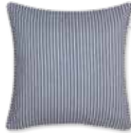
CUSHION STRIPE 4 colors available 45 x 45 cm 19,99 Euro