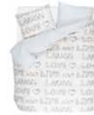
BED LINEN FLORES 100% Cotton Percalé e.g. 135/200 cm + 80/80 49,95 Euro