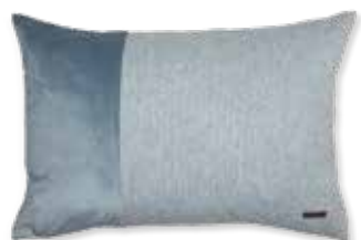
CUSHION HARP 38 x 58 cm / € 19,99