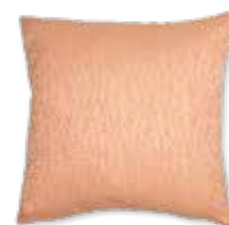
CUSHION FAN 45 x 45 cm / € 19,99