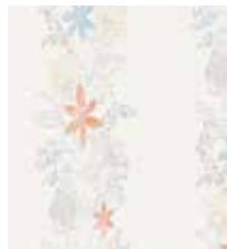
WALLPAPER ROMANTIC BOTANICS Flower design in 3 colors 0,53 x 10,05 m (5,33 sqm) 27,95 Euro