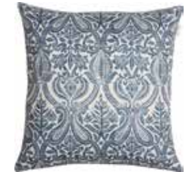
Cushion Hilary 45 x 45 cm / € 22,99