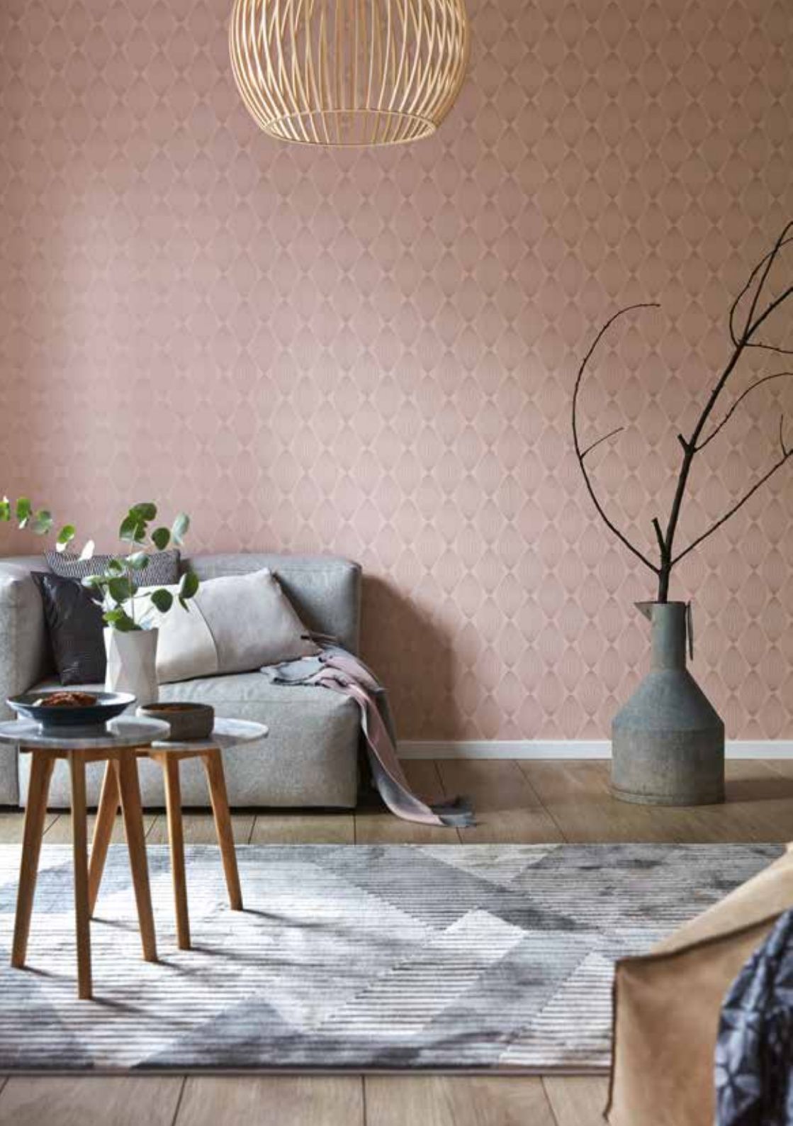
Wallpaper Minimalistic authenticity 0,53x10,05 m (5,33 sq.m) / € 23,95 Carpet Tamo e.g. 133x200 cm / € 199,00