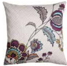
Cushion Flores 45 x 45 cm / € 22,99