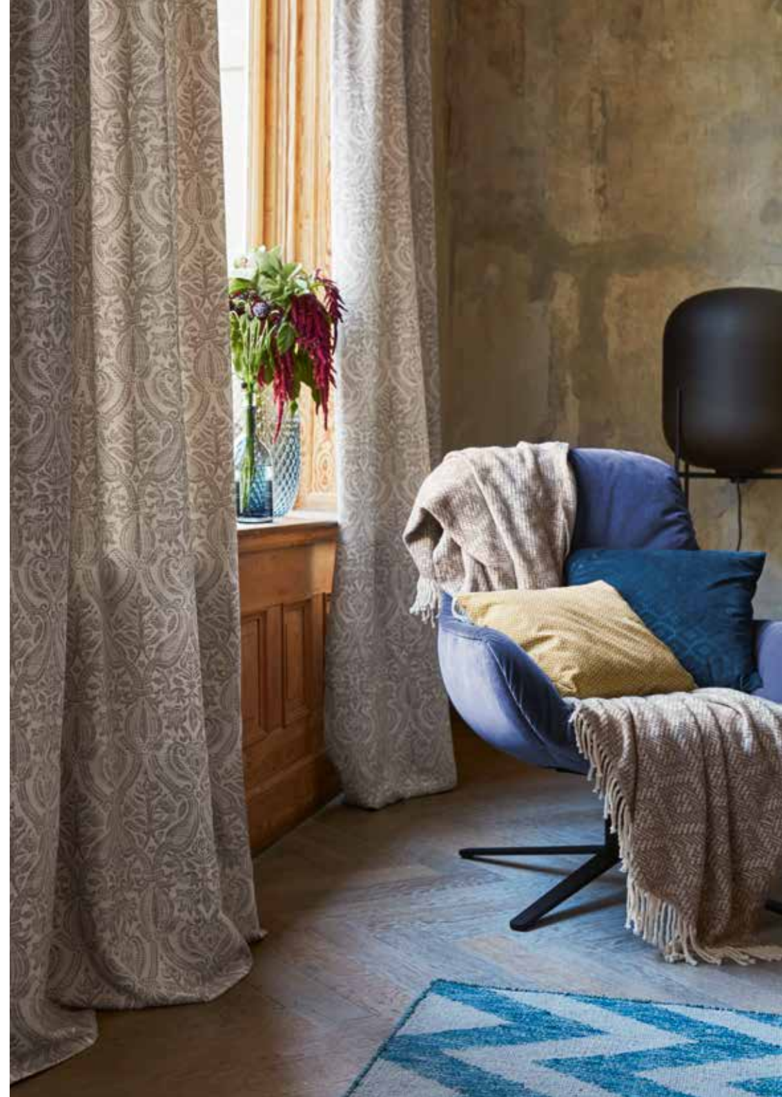
Curtain Hilary 140 x 250 cm / € 69,99 Plaid Daria 140 x 200 cm / € 79,99