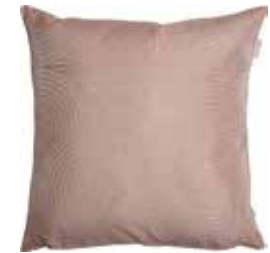
Cushion Cycle 38x38 cm / € 24,99