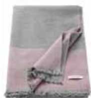
Plaid Shift 2 colors available 150x200 cm 89,99 Euro