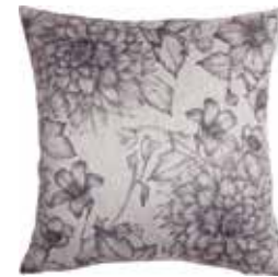
Cushion Madleine 45 x 45 cm / € 22,99