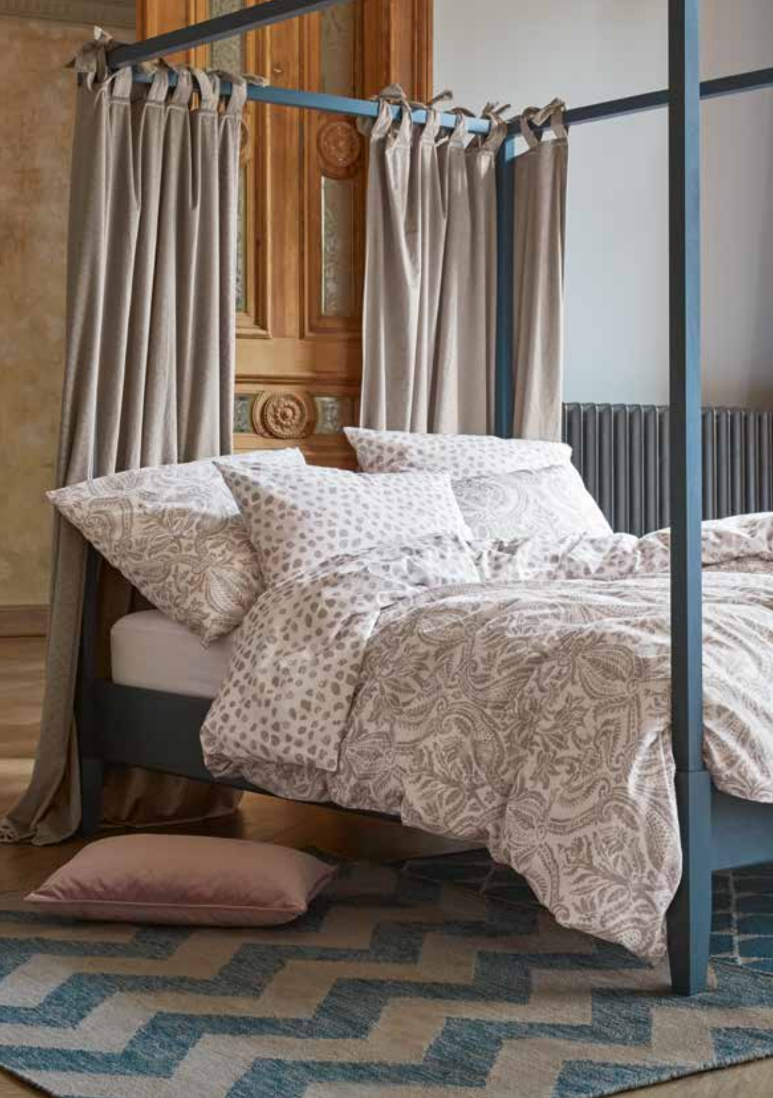
Bed linen Hillary e.g. 135/200 cm + 80/80 cm / € 69,95