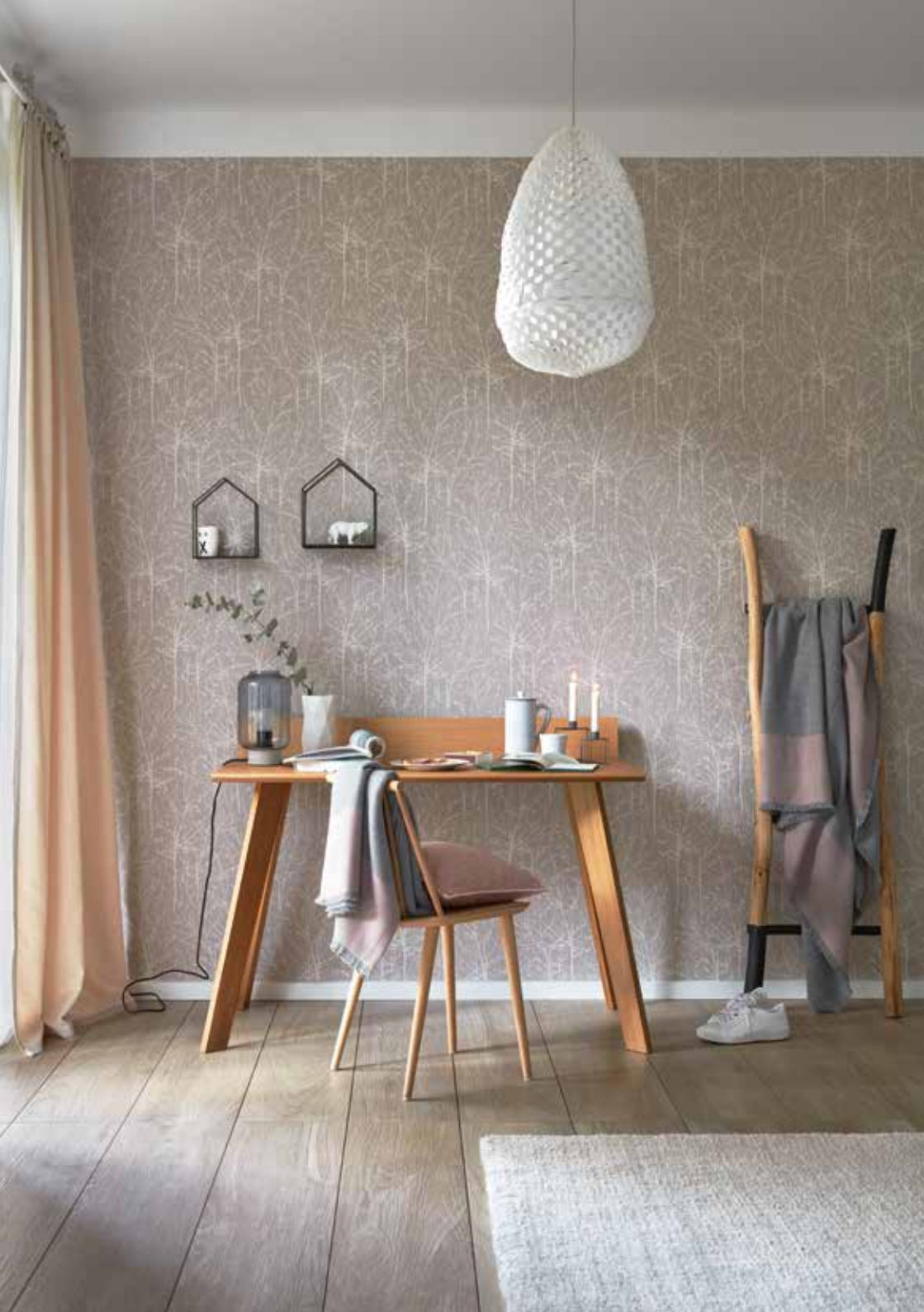
Wallpaper Minimalistic authenticity 0,53 x 10,05 m (5,33 sqm) / € 21,95