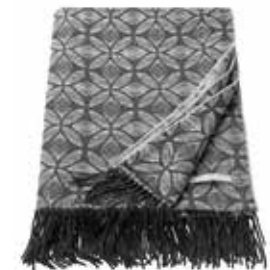
Plaid Starfleur 140x200 cm / € 89,99