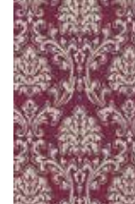
Wallpaper Eccentric luxury 3 colors available non-woven vlies wallpaper 0,53x10,05 m (5,33 sq m) 27,95 Euro