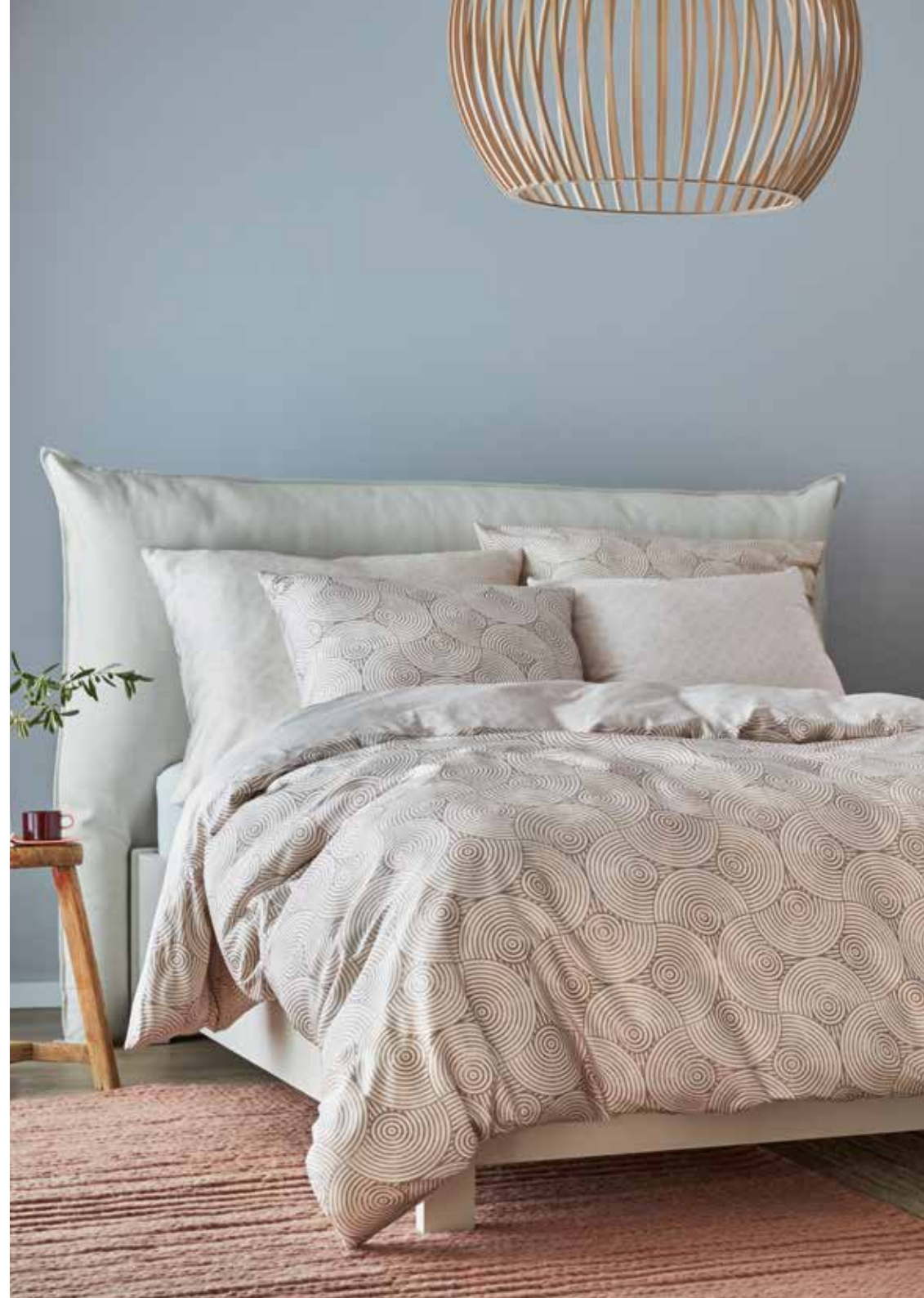
Bed linen Coy e.g. 135/200 cm + 80/80 cm / 69,95