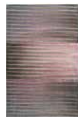
Carpet Lidija 2 colors available 100% polypropylene heatset frisée e.g. 133 x 200 cm 149,00 Euro