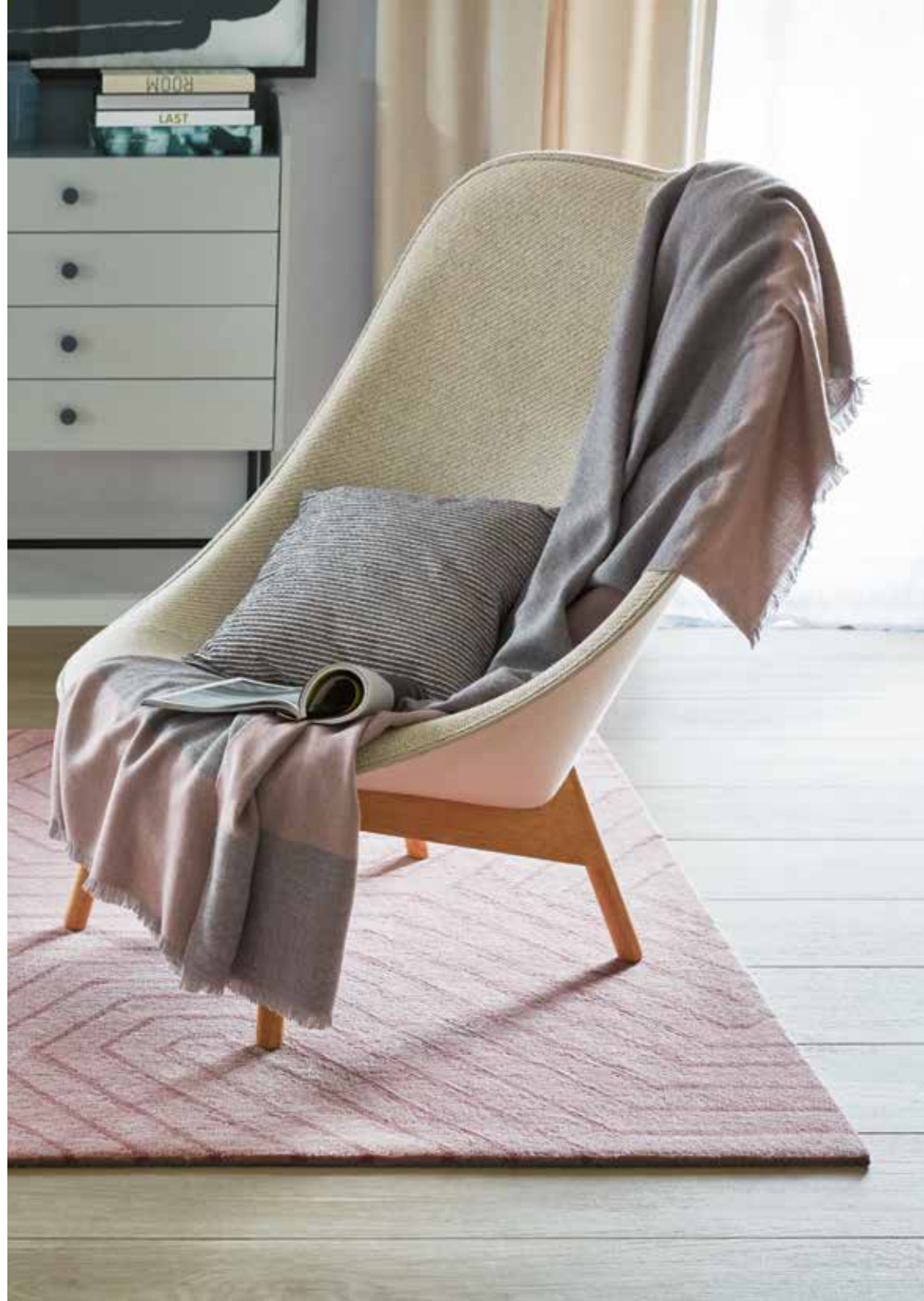
Carpet Raban e.g. 120 x 180 cm / € 499,00