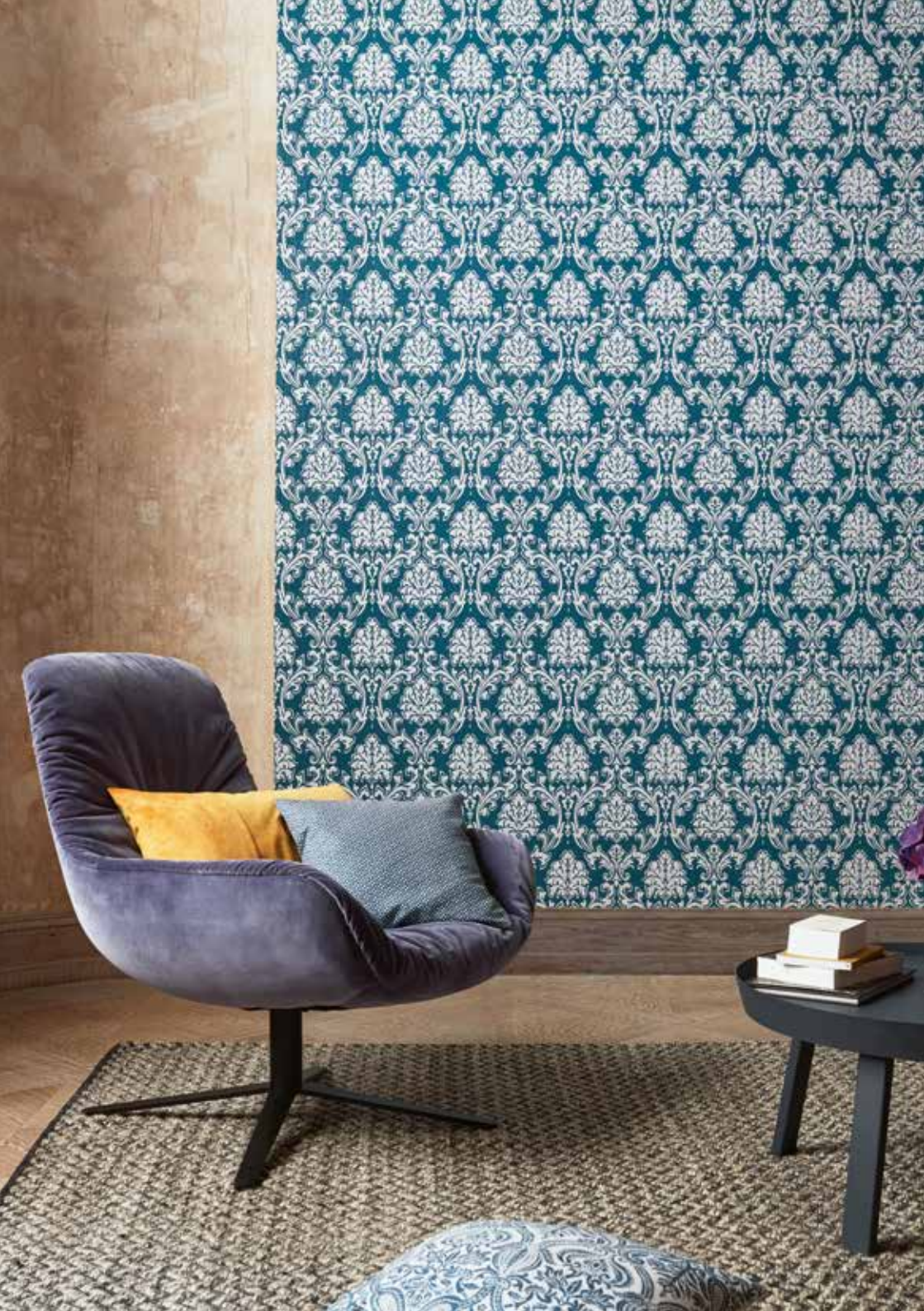
Wallpaper Eccentric luxury 0,53x10,05 m (5,33 sq m) / € 27,95