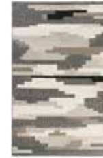
Natham Kelim 2 colors available hand-woven virgin wool GoodWeave label e.g. 130 x 190 cm 299,00 Euro