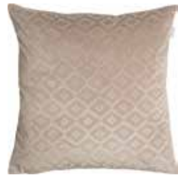
Cushion Romo 45 x 45 cm / € 24,99