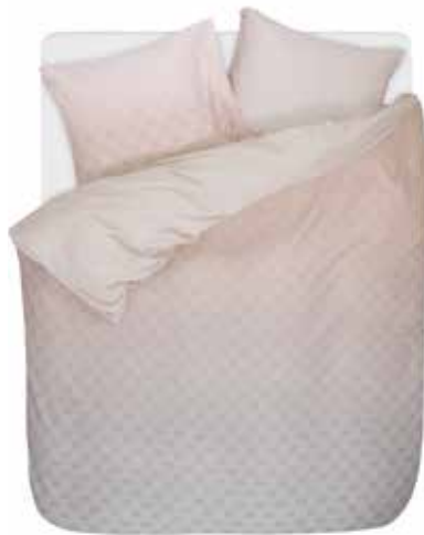
Bed linen Nouni e.g. 135/200 cm + 80/80 cm € 69,95