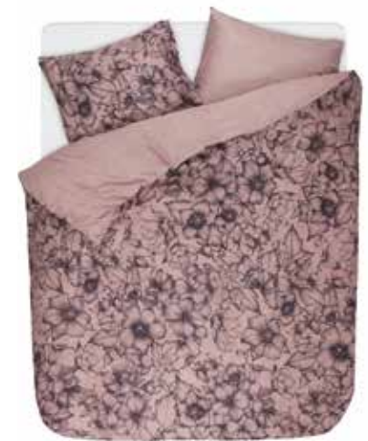
Bed linen Maray e.g. 135/200 cm + 80/80 cm € 69,95