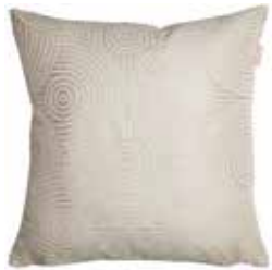
Cushion Cycle 38 x 38 cm / € 24,99