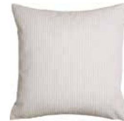
Cushion Softly 45 x 45 cm / € 19,99