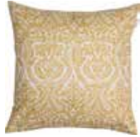
Cushion Hilary 3 colors available 45x45 cm 22,99 Euro