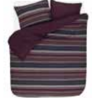
Bed linen Valiar 2 colors available 100% cotton/flannel e.g. 135/200 cm + 80/80 49,95 Euro