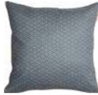
Cushion Mini 3 colors available 38x38 cm 19,99 Euro