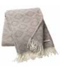
Plaid Daria 2 colors available 140x200 cm 79,99 Euro