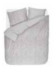
Bed linen Hillary 100% cotton/flannel e.g. 135/200 cm + 80/80 69,95 Euro