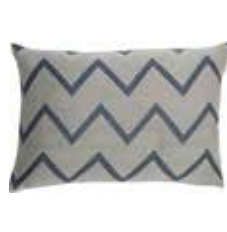
Cushion Zaro 2 colors available 38x58 cm 29,99 Euro