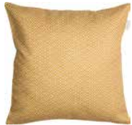
Cushion Mini 38 x 38 cm / € 19,99