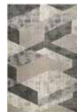
Carpet Tamo 50% polypropylene 50% polyester e.g. 133 x 200 cm 199,00 Euro