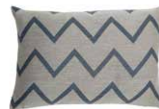
Cushion Zaro 38x58 cm / € 29,99