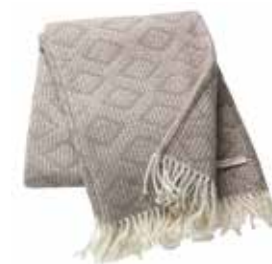
Plaid Daria 140x200 cm / € 79,99