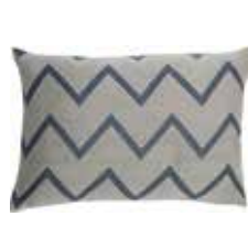
Cushion Zaro 2 colors available 38x58 cm 29,99 Euro