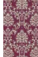
Wallpaper Eccentric luxury 3 colors available non-woven vlies wallpaper 0,53x10,05 m (5,33 sq m) 27,95 Euro