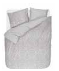
Bed linen Hillary 100% cotton/flannel e.g. 135/200 cm + 80/80 69,95 Euro