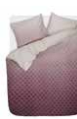
Bed linen Nouni 3 colors available 100% cotton/sateen e.g. 135/200 cm + 80/80 69,95 Euro