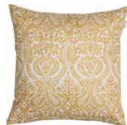
Cushion Hilary 45 x 45 cm / € 22,99