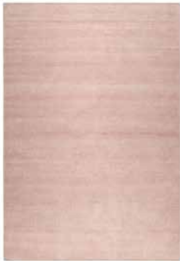
Maya Kelim e.g. 133 x 200 cm / € 199,00