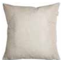
Cushion Cycle 3 colors available 38x38 cm 24,99 Euro

All prices in this brochure are German recommended retail prices and may vary from country to country.