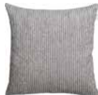
Cushion Softly 2 colors available 45x45 cm 19,99 Euro