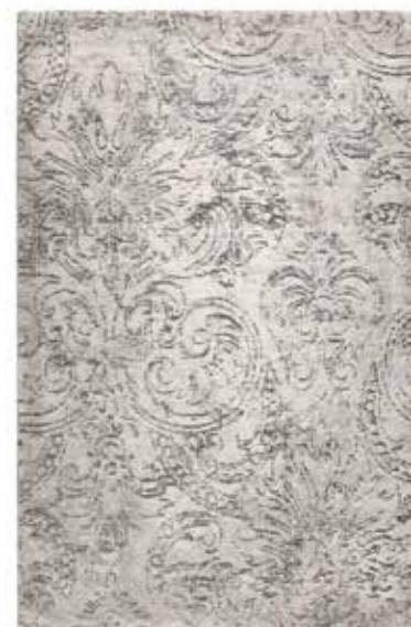
Carpet Elda e.g. 133x200 cm / € 199,00