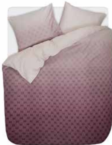
Bed linen Nouni e.g. 135/200 cm + 80/80 cm € 69,95