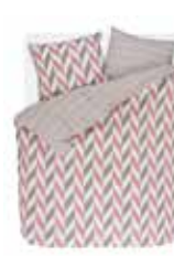
Bed linen Criss Cross 2 colors available 100% cotton/flannel e.g. 135/200 cm + 80/80 49,95 Euro