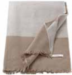
Plaid Shift 150 x 200 cm / € 89,99