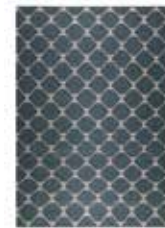
Aaron Kelim 2 colors available hand-woven virgin wool GoodWeave label e.g. 130 x 190 cm 269,00 Euro