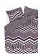
Bed linen Ziggy Zag 2 colors available 100% cotton/flannel e.g. 135/200 cm + 80/80 49,95 Euro