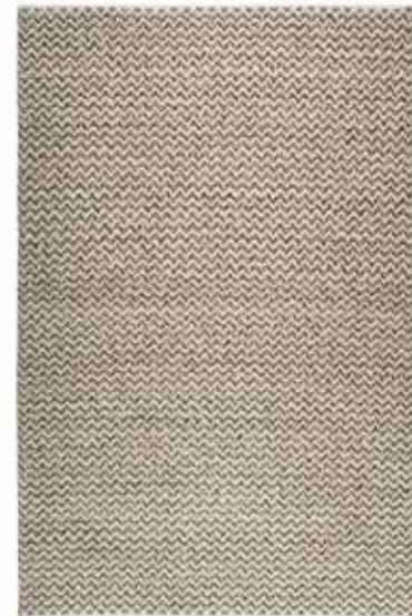
Sandi Kelim e.g. 130x190 cm / € 269,00