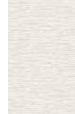
Wallpaper Eccentric luxury 3 colors available vlies wallpaper with texture 0,53x10,05 m (5,33 sq m) 23,95 Euro