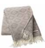
Plaid Daria 2 colors available 140x200 cm 79,99 Euro