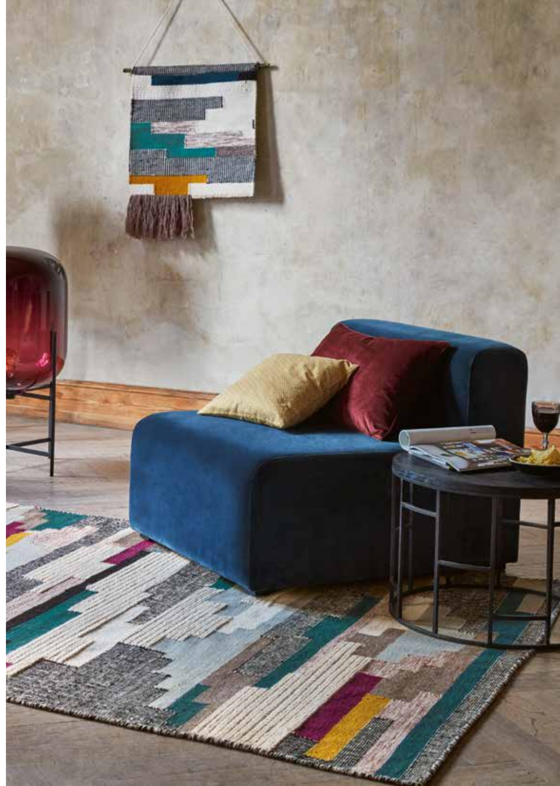
Natham Kelim e.g. 130 x 190 cm / € 299,00