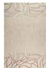
Carpet Tenya 2 colors available hand-tufted virgin wool e.g. 120 x 180 cm 499,00 Euro