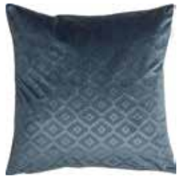
Cushion Romo 45 x 45 cm / € 24,99