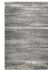
Carpet Makai machine-woven e.g. 120 x 170 cm 149,00 Euro