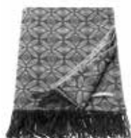
Plaid Starfleur woven jacquard design 140x200 cm 89,99 Euro