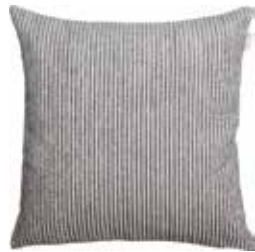
Cushion Softly 45 x 45 cm / € 19,99