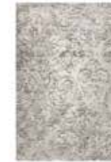
Carpet Elda machine-woven e.g. 120 x 170 cm 149,00 Euro